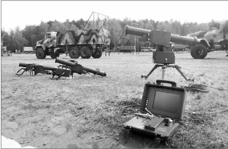
Броньовані КраЗИ та ПТУР "Скіф" і "Бар'єр" із системою дистанційного керування.